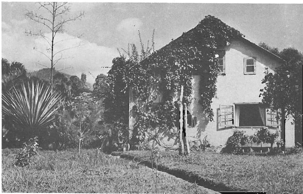
Siirtokunnan perustajan Toivo Uuskallion koti.

Suurta tyytymättömyyttä ja ennen pitkään myös karvasta katkeruutta herätti