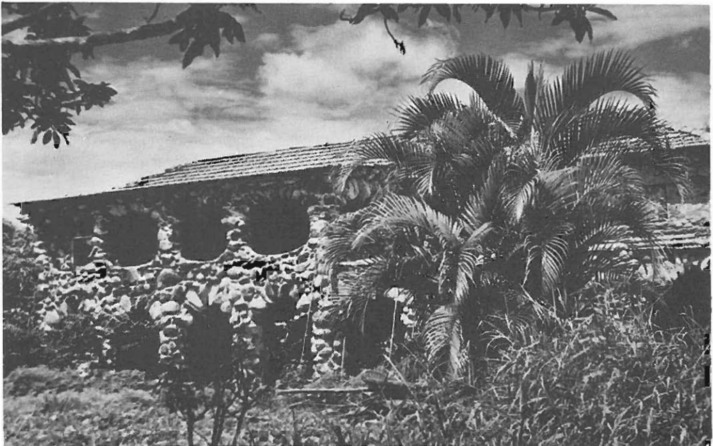
Eksoottista uudenpa Penedoa. Toivo Asikaisen kivilinna.

Penedon suureen muodonmuutokseen kuuluu olennaisena osana suomalaisten siirtyminen maanviljelyksestä ja hedelmänviljelyksestä uusille urille: täysohitoiloiden ja saunojen pitoon sekä erilaisiin aloitekykyä, idearikkautta ja ammattitaitoa vaativiin käsi- ja taidekäsiyöammatteihin. Uuden Penedon symbolina voidaan hyvin pitää pesukurkkulakkia. Suomalaisen työn ohella edellytyksenä tälle muodonmuutokselle ovat olleet Penedon edullinen sijainti Rio de Janeiron ja Sao Paulon välisen uuden valtatie valmistumisen jälkeen ja tämän tien lomailijoille avaama Penedon maiseman kauneus ja ilmaston miellyttävyys. Penedosta on näin tullut