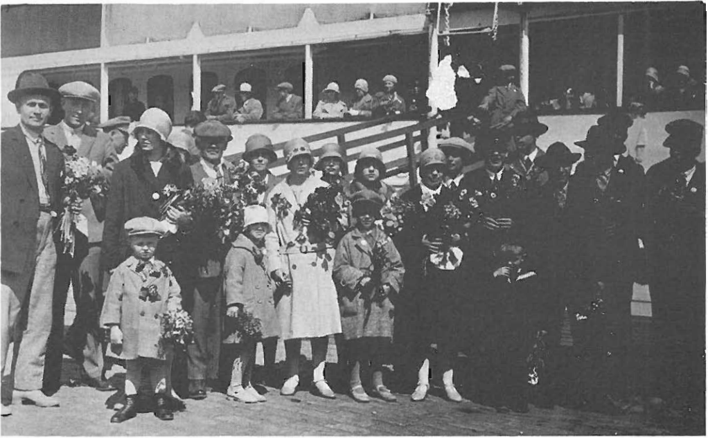
Siirtolaisryhmä Helsingin satamassa lähdössä Penedoon kesällä 1929.

Jo kevään 1929 kuluessa Penedoon tippui muutamia pieniä suomalaisryhmiä, kunnes kesäkuun 18. päivänä perille saapui ensimmäinen suurempi suomalaisjoukko, yhteensä 28 henkeä. Kymmenkunta päivää myöhemmin tuli Penedoon vieläkin suurempi ryhmä, kaikkiaan 32 henkeä ja edelleen heinäkuun alkupuolella 27 henkeä. Brasilian virallisten siirtolaistilastojen mukaan v. 1929 maahan saapui 139 suomalaista. On pääteltävissä, että nämä suomalaiset muutamaa poikkeusta lukuun ottamatta olivat tulleet juuri Penedoon.