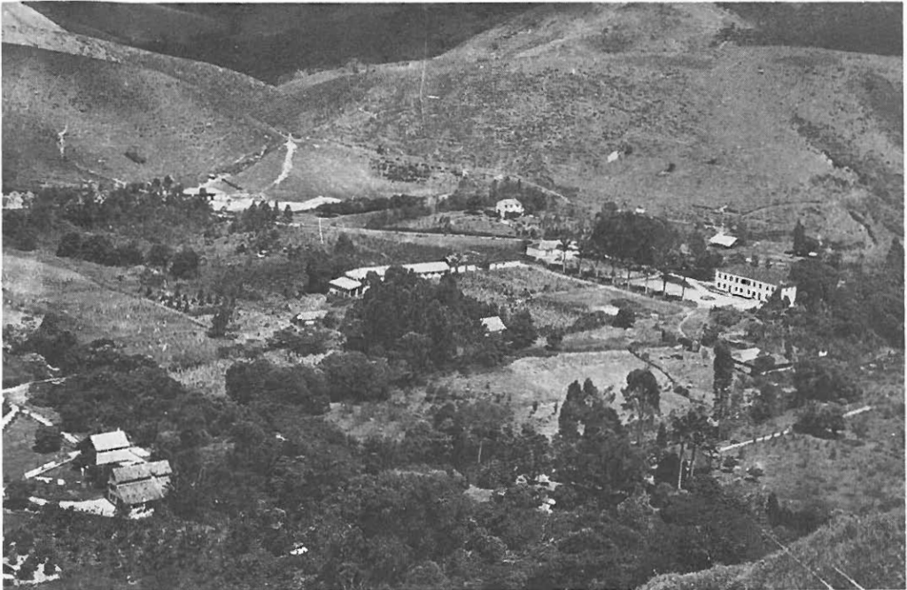
Yleisnäkymä Penedon laaksosta Penedon kukkulalta nähtynä. Istutukset ja rakennukset ovat suomalaisten tekemiä päärakennusta lukuunottamatta.

henkilöitä, päätöksen teki selväksi voimakas ihanteellisuus ja vilpittömän innostus Penedon korkeisiin päämääriin. Sen sijaan nuorempien lähtijöiden kohdalla suurempi osuus oli yksinkertaisesti seikkailunhalulla: Brasiliaan ja Penedoon ja koko Etelä-Amerikkaan liittyi jotakin uutta, sensaatio-maisen jännittävää ja eksoottisen kiihottavaa. Hyvinkin villit kuvitelmat aarniometsistä, käärmeistä ja intiaaneista toki pelottivat, mutta vetivät samalla oudolla tavalla puoleensa.