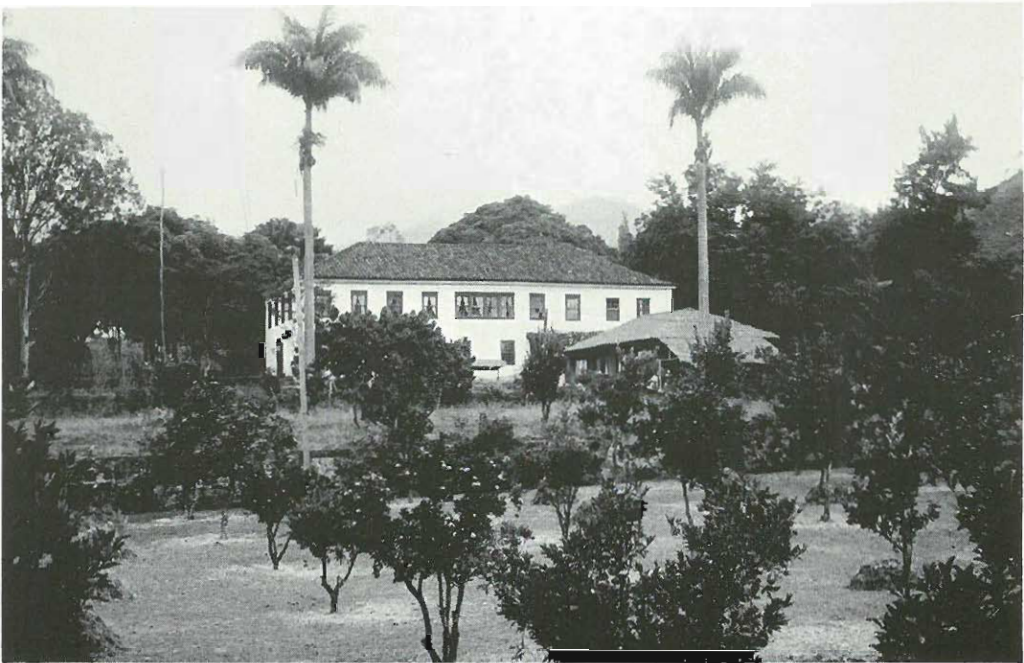
Penedon vanha koloniaalityylinen päärakennus kuningaspalmujen keskellä.

Jo Penedosta nopeasti pois lähteneiden huomattavan suuri osuus on varma osoitus siitä, että sopeutuminen vieraisiin oloihin tuotti useille suomalaisille odottamattomia vaikeuksia ja että todellisuus paikan päällä tuotti pettymyksen. Herääminen paratiisiunelmista ankaraan arkipäivään sai monet pakkaamaan laukkunsa pikaista kotimatkaa varten. Vaikka "kesän maan" luonto oli rehevä ja yltäkyläinen, hedelmät eivät pudonneet ilman työtä suoraan makaajan suuhun täälläkään. Penedon köyhtyneet ja puhtaaksi kalutut maat olivat todellinen haaste uuteraan työhön.