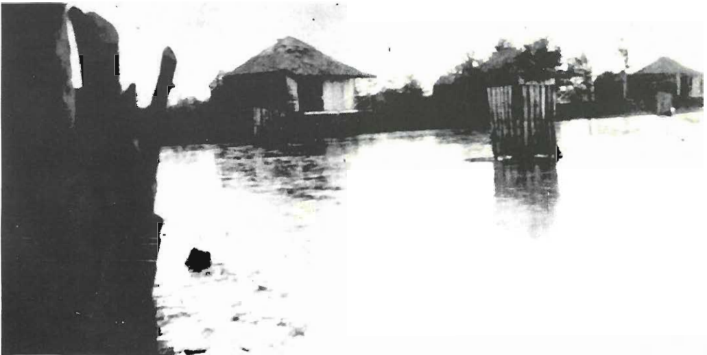
Sateiden ja tulvan aikaan muutoin peräti kuiva suomalaissiirtokunta saattoi näyttää tällaiselta. Juuri tulvia ajatellen valtion rakennuttamat palmukattoiset asunnot oli rakennettu korkeahkojen puupilarien varaan.

Vähitellen suomalaisille alkoi selvitä myös se, etteivät he itse asiassa muodostaneet mitään omaa suomalaista siirtokuntaa. Dominicanisen tasavallan hallituksen nimenomaisena tarkoituksena oli suorastaan estää puhtaasti kansallisten siirtokuntien muodostuminen; jo ennen suomalaisten tuloa Villa