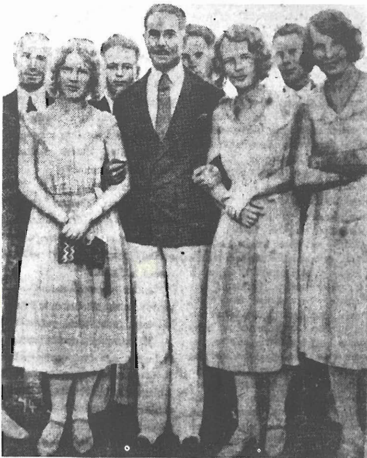
Vuoden 1930 vallankaappauksen jälkeen Dominikaanisen tasavallan uusi presidentti Rafael Lednidas Trujillo Molina vieraili useampaan otteeseen suomalaisten keskuudessa. Vaikka tämä vuosisatamme rautaisimpiin diktaattoreihin kuuluva caudillo oli niin pelätty, ettei hänen nimeäänkään uskallettu lausua, hänellä tuntuu olleen asiantuntijan lempeä silmä suomalaiselle naiskauneudelle.

Pahan pettymyksen suomalaiset kokivat myös seudun terveellisyyden suhteen - olihan moni uudisasukas lähtenyt kotimaasta juuri täydellistä terveyttä etsimään. Veden-