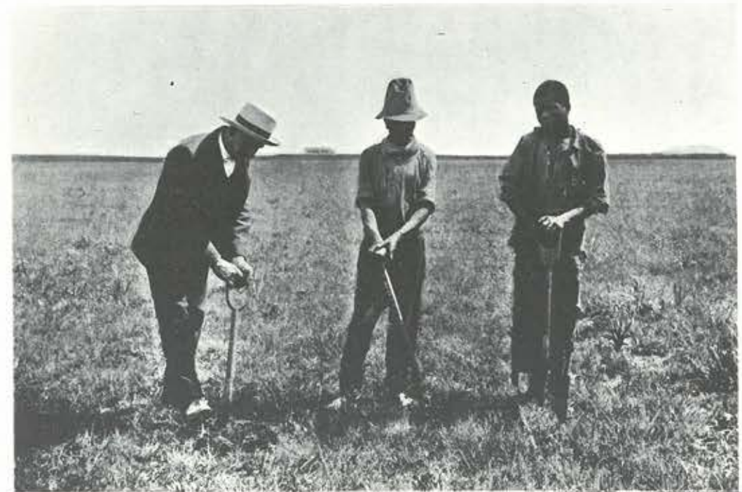
Etelä-Afrikassa valkoinen mies oli työnjohtaja, "bas". Kaiken raskaamman ruumiillisen työn tekivät mustat.

Näinä samoina kuumeisen kasvun vuosina löysivät myös suomalaiset siirtolaiset tiensä Johannesburgiin. Suomalaisten oleskelusta alueella on tosin tietoja aina 1890-luvun alkuvuosista lähtien, mutta vasta v. 1895 Johannesburg alkoi todenteolla vetää muuttajia puoleensa. Seudulle aiemmin asettuneiden välityksellä koti-Suomeen oli levinnyt houkuttelevia tietoja sikäläisistä oloista; työtä olisi tarjolla ja palkat huippuluokkaa.