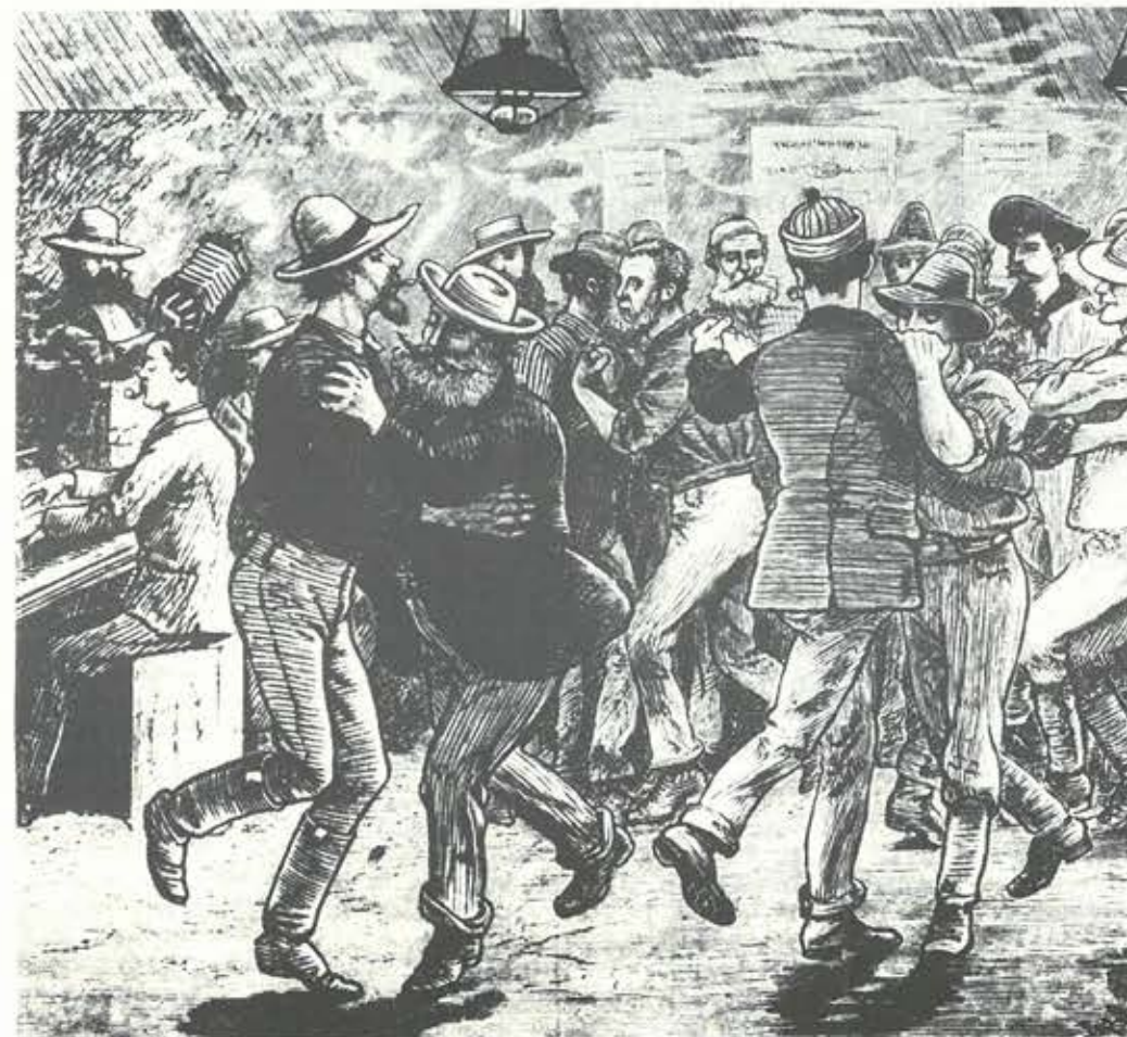
Johannesburg oli miesten kaupunki. Tanssipartnerikin oli valittava sen maukaisesti.

Miten kaivosmies käytti vapaa-aikansa? Suomalaiset kutsuivat Johannesburgia kaupungiksi, jossa elettiin hyvin, syötiin usein ja juotiin vielä useammin. Edellyttäen, että oli töitä. Mikäli työttömyys oli yllättänyt, syötiin harvemmin. Johannesburgin suomalaisilla voi katsoa olleen kaksi kilpailevaa harrastusta, rahan säästäminen ja rahan tuhlaaminen. Toiset elivät hyvinkin säästäväisesti ja lähettivät huomattavia rahasummia koti-Suomeen. Heille viikonloppu merkitsi kaivattua lepoa. Kaikki eivät kuitenkaan säästäneet. Monet elivät vain viikonloppua