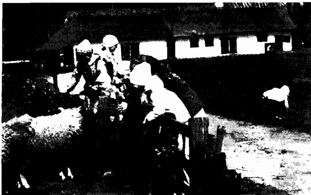
Kööpenhaminan suomalaisen seuran lastenkerhon kevätretki kevaalla 1982

Tanskan alkoholipolitiikka on huomattavasti sallivampaa kuin muiden pohjoismaiden ja myös huumeitten saanti on helpompaa. Tämä yhdessä Kööpenhaminan suurkaupunkimaisen ilmapiirin kanssa vetää monia ihmisiä, joilla ei omassa maassaan ole riittävästi kiinnekohtia. Useat edellä mainituista henkilöistä eivät ole edes virallisesti muuttaneet Tanskaan, eivätkä siis näy tilastoissa.