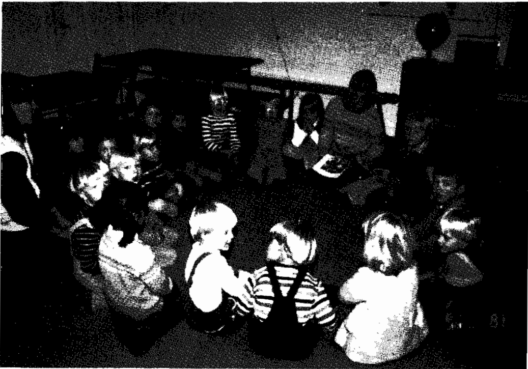
Kööpenhaminan suomalaisen seuran lastenkerho.

Erään osan Tanskan suomalaisista muo- dostavat kansainvälisten yritysten ja jär- jestöjen palveluksessa olevat henkilöt. Hei- dän oleskelunsa on usein määräaikaista tai muuten tilapäistä luonteeltaan.