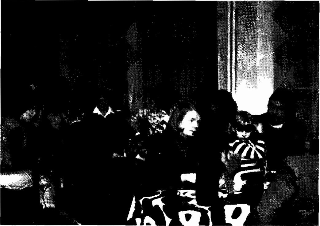
Kirkkokahvit Kööpenhaminan suomalaisen seuran huoneistossa kevaalla 1982.

Myös Århusissa ja sen ympäristössä asuvat suomalaiset ovat lähes kaksi vuotta sitten perustaneet oman seuransa: Århusin Suomi-kerhon. Myös tämä seura pyrkii järjestämään yhdessäolomahdollisuuksia alueen suomalaisille illanviettoineen, lento- ja pesäpalloharrastuksineen. Jäsenmäärä on tällä hetkellä noin 70.