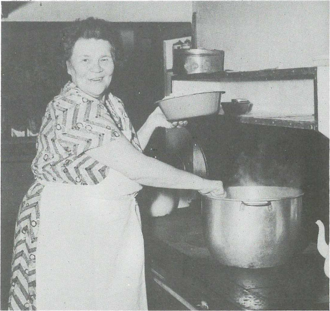
Suomalaisnaiset työskentelivät usein tarjoilijoina ja kokkeina ensin suomalaisissa "poortitaloissa" ja myöhemmin muissakin hotelleissa ja ravintoloissa, kuten tämäkin Suomi Hovin kokki.

vain kolme seinäjokelaistyttyä lähti siirtolaiseksi. Edellisvuonna oli lähtijöitä ollut 26, ja seuraavana vuonna lähti taas 16. Mainittu vuosi oli koko Suomen mittakaavassakin laimea muuttovuosi, joskin Seinäjoen tapauksessa suhteellisen rajut heitot voi panna osin pienen populaation syyksi. Puro ei vähällä ehtynyt, sillä kotitaloustöihin lähtenyt odotti Valloissa ruusuinen tulevaisuus. Ensinnäkin piian palkka oli Amerikassa satumaisen korkea. Vierasta kieltä osaamaton vasta-alkajakin sai palkkseen noin viisinkertaisesti sen mitä Suomessa. Kun suomalaispalvelija oli oppi-