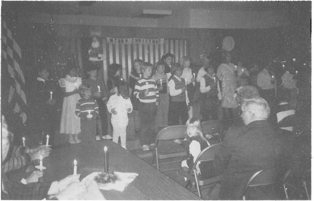
Aura-haalin joulujuhlan alkulaulu 14.12.1986.

keskuksia. Ensimmäisen polven siirtolaisista on suuri osa jo eläkeläisiä, mutta on myös uusia siirtolaisia - suomalaisia, jotka ovat tulleet tänne hankkimaan ammattia ja opiskelemaan, perustaneet perheen ja jääneet vähitellen pysyvästi. Toisen ja kolmannen polven suomalaisia toimii kaikissa ammateissa sorvareista professoreihin.