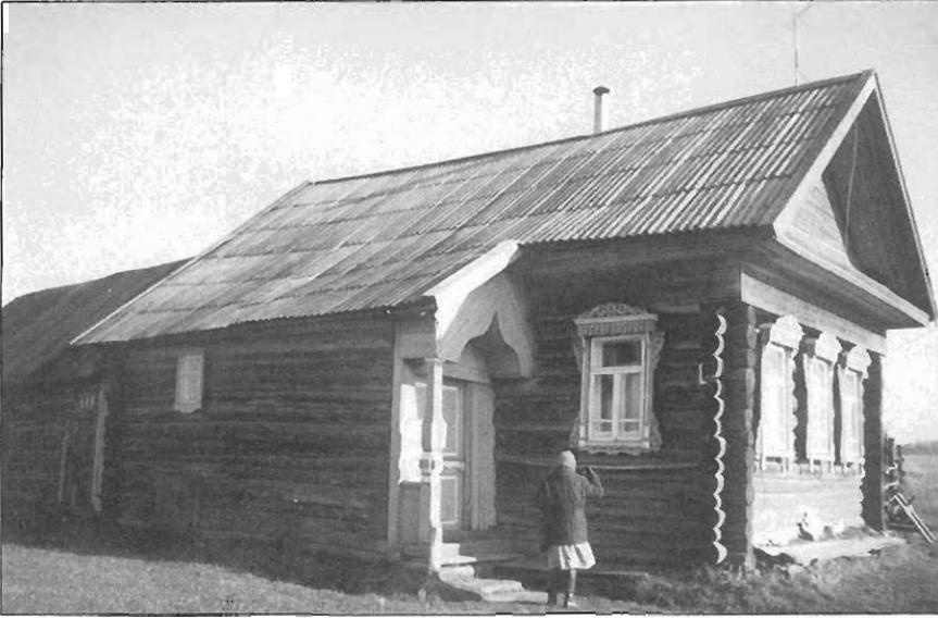
Karjalaistalo Rameshikin piirin Kuznetsovan kylässä. Taloja peruskorjattiin tässä piirissä.

matkustaneen lähetyskunnan johtaja kreivi Erik Gyllenstierna tsaarille luettelon ”karkureista”, ja sen mukaan koottiin tiedot heidän olinpaikoistaan tuona vuonna. Toinen, huomattavasti lyhempi selvitys laadittiin vuonna 1653 1 .