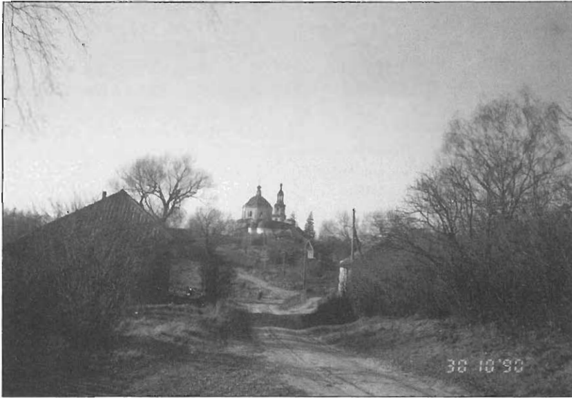
Kuznetsovan kylä ja kirkko Ruameškissa.

Onnellisinta tietysti olisi, jos kumpikin vähemmistökansa voisi kehittää omia olojaan ja omaa kulttuuriaan nykyisellä kotiseudullaan vapaana tsaristisesta tai bolshevistisesta painostuksesta. He kaikki tarvitsevat itsetuntonsa vahvistamiseksi kosketusta Suomeen ja tarpeen mukaan tukeakin kirjoittamaan heidän omia voimiaan oman henkisen ja aineellisen viljelyn hyväksi.