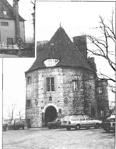
The Polonia Institute, Jagiellonian University, lies on the top of a beautiful hill six kilometres outside Cracow