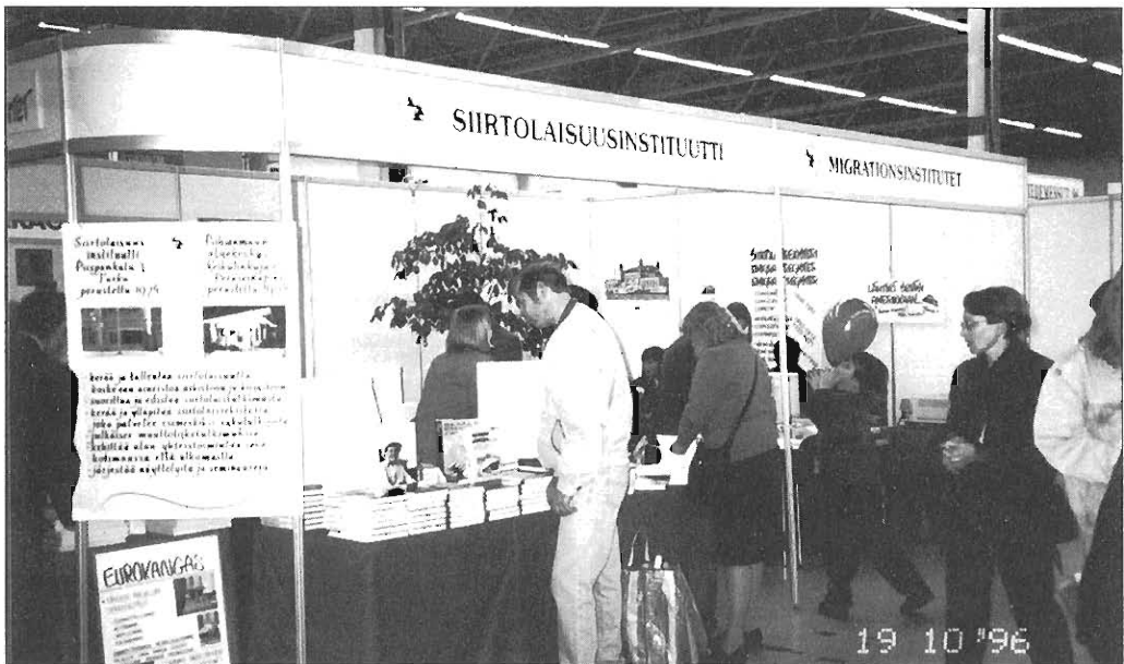
Siirtolaisuusinstituutti on ollut vuoden 1996 aikana mukana monissa tapahtumissa. Kiinnostus Instituutin toimintaan on kaikkialla ollut suuri. Kuva Turussa lokakuussa pidetyiltä Kirja- ja tiedemessuilta.