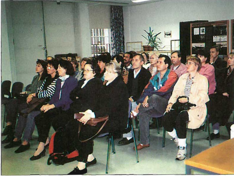
Siirtolaisuusinstituutissa käy vuosittain satoja vierailijoita. Kuva 17.9.1997 esittelyluentoa kuuntelevasta Turun Ammatillisen Kurssikeskuksen maahanmuuttajaopiskelijoiden ryhmästä.

Finland, Canada and Trinidad. Migration Studies C 12. Vammala 1997, 244 p.