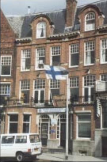
Suomen merimieskirkko Rotterdamissa Hollannissa. – Johtoloisto , nro 6/2001.

talaisuudesta sekä buddhalaisuuden ja hindulaisuuden pohjalta syntyneistä yhteisöistä.