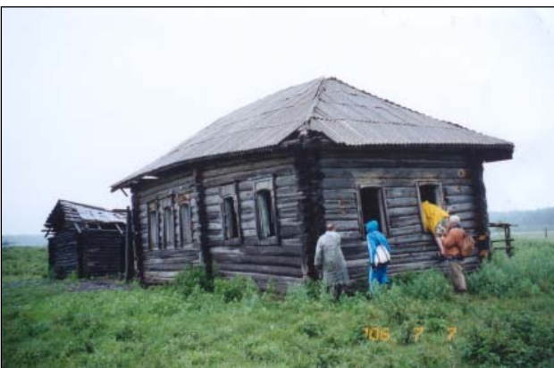
Suomalaiset Siperiankävijät pyrkimässä sisään autoon Unkurin taloon. He löysivät talon huonokuntoisena, mutta yhä pystyssä, heinäkuussa 2006.