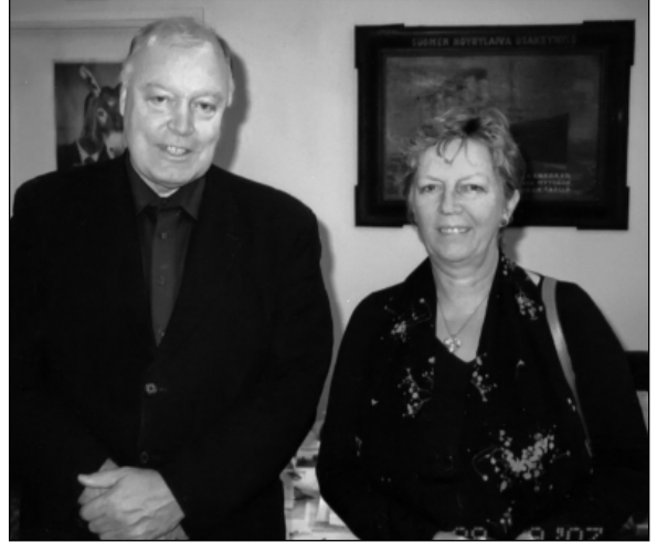
Ulkoministeriön alivaltiosihteeri Pekka Huhtaniemi vaimoineen vieraili Instituutissa syyskuussa 2007.