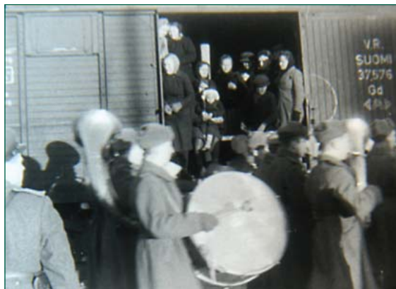
Inkeriläisiä palaajia kohtasi Viipurissa joulukuussa 1944 juhlallinen vastaanotto, johon kuului mm. neuvostoarmeijan torvisoittokunta.

Muodollisesti, periaatteessa vapaaehtoisina Suomeen saapuneina, eivät inkeriläiset kuuluneet ehdottomasti palautettavien joukkoon. De facto inkeriläisten vaihtoehdot paluun tai jäämisen suhteen olivat yh-