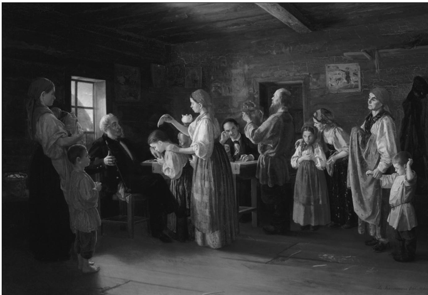
Vasili Kalistov "Kasvatuslaitoksen orpolasten tarkastuttaminen" (1866).

Eri säätyihin kuuluneet tulijat vaikuttivat väestön sosiaaliseen rakenteeseen tuomalla monipuolisuutta alueen kulttuuriympäristöön ja nostamalla yleistä koulutustasoa. Pietarilaisten aateliin, lomalaisten, ammattityöläisten sekä suomensuomalaisten maanviljelijöiden tulomuutot nopeuttivat kulttuurista vaihtoa, toivat elinkeinoja koskevia innovaatioita ja edesauttoivat paikallisten käsitöiden, teollisuusalojen ja markkinoiden kehittymistä.