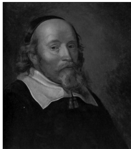
Louis de Geer 1587–1652.