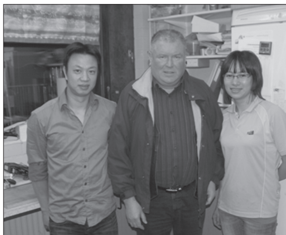
Bild 2. Gamla och nya närpesbor.

De unga närpesborna med invandrarbakgrund söker ännu sin plats i samhället. Deras utbildningsmöjligheter är av språkliga orsaker mer begränsade