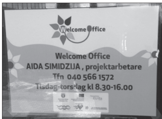
Bild 1. Welcome Office i Närpes stadshus.

Integrationsmetoderna är ett resultat av tjuugo års utvecklingsarbete. Då de första flyktingar-