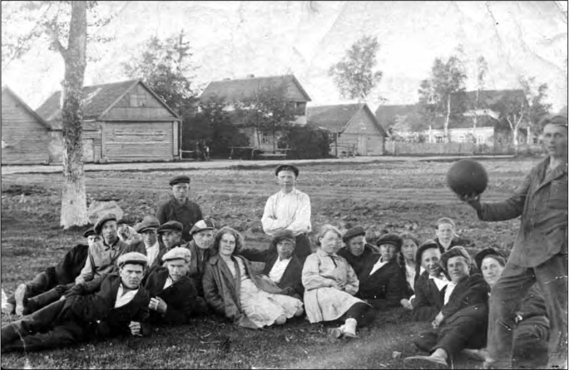
"Kasukan kylän nuorisoa Keski-Inkerissä v. 1932."

Jos arvoisilla lukijoilla on tietoa Kasukan kylästä tai kuvassa olevista henkilöistä, otamme tiedon mielellämme vastaan! Tiedot voi toimittaa osoitteeseen jarno.heinila@utu.fi tai puhelimitse +358 (0)2 28 404 60.