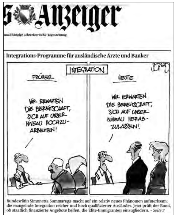
Kuva 3. Ennen: Odotamme teidän nostavan itsenne meidän tasollemme. Nyt: Odotamme teidän laskevan itsenne meidän tasollemme. (Tages-Anzeiger 5.5.2012).

Expatriaatit ovat monin tavoin etuoikeutetussa asemassa: paitsi, että he saavat parempaa palkkaa ja asuvat paremmissa asunnoissa kuin sveitsiläiset, heillä on tuntevia veroetuja. He voivat esimerkiksi vähentää asumiskustannukset, lasten koulumenot ja muuttokustannukset veroistaan. Viiden vuoden kuluttua tai vakituisen työ sopimuksen solmimisen jälkeen nämä edut poistuvat. Etuoikeudet ovat olleet puolittain piilossa, kun varakkaat ulkomaalaiset ovat pysytelleet omissa oloissaan, mutta kun he avautuvat ympäröivään yhteiskuntaan ja laittavat lapsiaan valtiollisiin kouluihin yksityiskoulujen sijasta, etuoikeudet paljastuvat selvemmin. Kuvavaa on Tages-Anzeiger -lehden etusivun pääotsikko