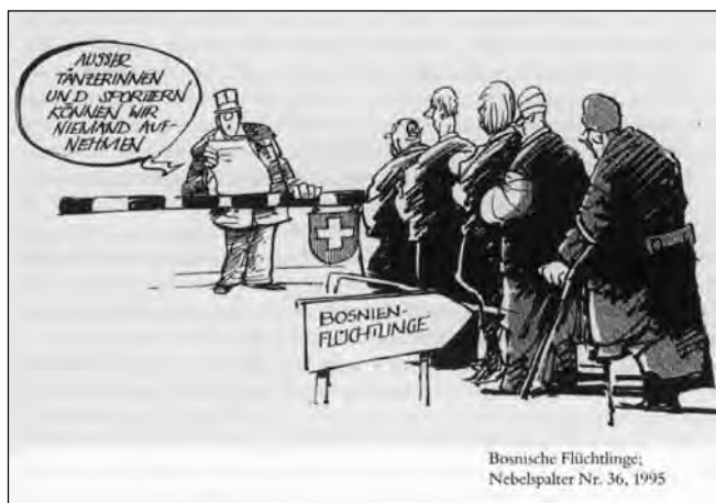
Kuva 1. “Emme voi ottaa muita kuin tanssijoita ja urheilijoita” (Wottreng 2000, 187).

tiin kolmen kehän malli “Modell der drei Kreise”. Se asetti selvät prioriteetit eri maiden kansalaisten maahanmuutolle: sisäkehään kuuluivat EU:n ja EFTA:n kansalaiset, joilta tuli poistaa kaikki ulkomaalaispoliittiset ja työmarkkinaesteet. Keski-kehään kuuluivat “muut perinteiset rekrytointialueet”, joiden suhteen maahanmuuttoa voi helpottaa, kuten Yhdysvallat, Kanada ja Australia. Ulkokehään kuuluivat kaikki muut maat. Näihin sovellettaisiin vuoden 1973 rajoittavaa politiikkaa.