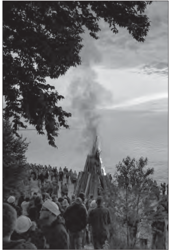
Toivolan Agate Beachilla pidettiin perinteinen Juhannusjuhla, johon osallistui runsaasti myös FinnFest-tapahtumaan osallistujia.