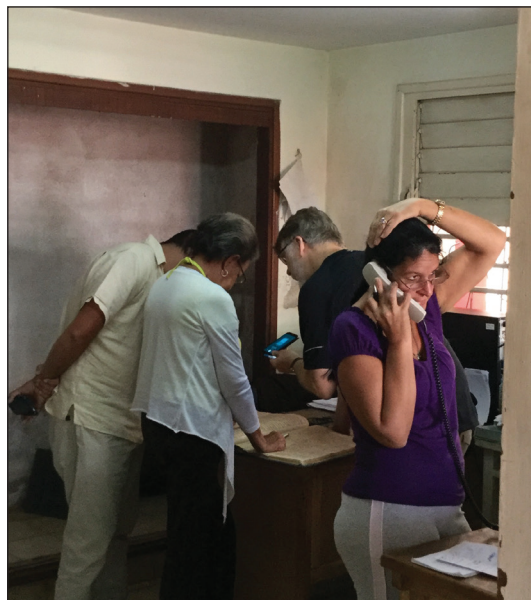
Martin rekisteriviranomaiset olivat tehokkaita.

Itabossa on asukkaita nykyisin reilut 1 000 henkeä. Kaupunki kuuluu hallinnollisesti naapurikaupungin eli Martin alaisuuteen. Niinpä aloitimme etsintämme vieraillemalla paikallisessa museossa. Siellä ei suomalaisista tiedetty mitään. Museossa, kuten muissakin virastoissa jopa ihmeteltiin intoamme hakea suomalaisia juuria – ne kun eivät ole Kuubassa kiinnostavia aiheita. Seuraavaksi siirryimme Martissa olevan katolisen kirkon puoleen. Kirkko oli viime vuosisadan alussa keskeinen instituutio ja Martin seurakunnan kirkonkirjat suorastaan pursusivat sakastin takaisessa huoneessa. Valitettavasti täälläkin vedimme vesiperän. Saimme kuitenkin mielenkiintoisen vinkin. Itabolainen senor Chichi on kylän vanhimpana asukaana 83-vuotias ja omaa kuulemma hyvän muistin. Hän jos kuka tietäisi esimerkiksi 1930-luvulla eläneet ja heidän taustansa. Ystävämme olikin tavatessamme pirteä ja hänellä oli todellakin hyvä muisti. Chichin kommentit voi kiteyttää seuraavasti: "Ooh, täällä oli paljon ihmisiä eri maista, mutta kaikki olivat kuubalaisia. Ei suomalaisista erikseen puhuttu". Paikallisen koulun opettajat levittivät käsiään. Itabon hautausmaan tutkiminen ei sekään vienyt asiaa yhtään eteenpäin – sieltä ei löytynyt ainoatakaan merkintää